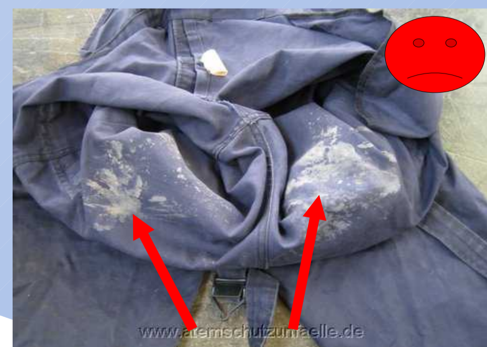
Hautreiste !!! - Schwere Brandverletzungen

Überhose war in der Reinigung! Der Truppkollege mit Überhose blieb nahezu unverletzt.