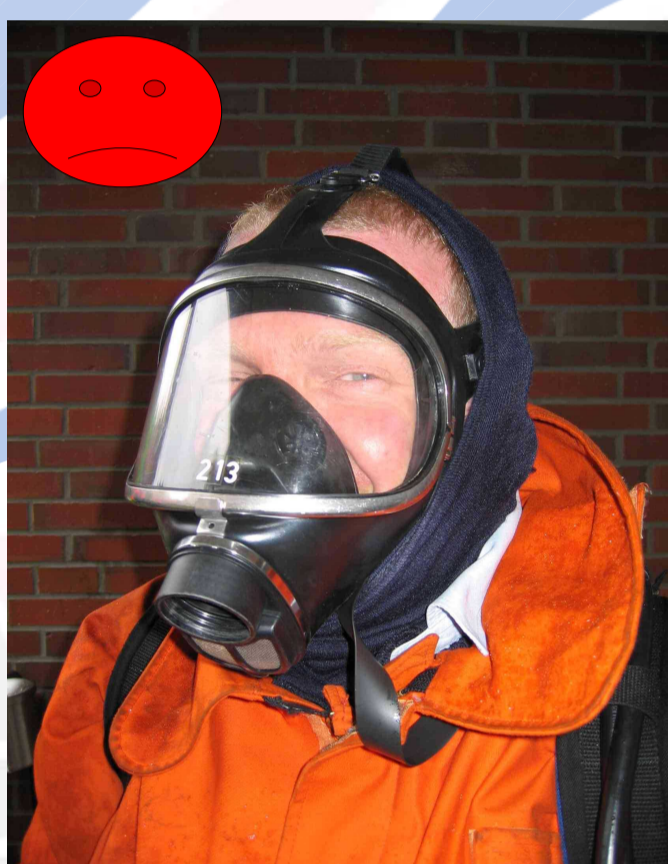
Feuerschutzhaube zu eng!