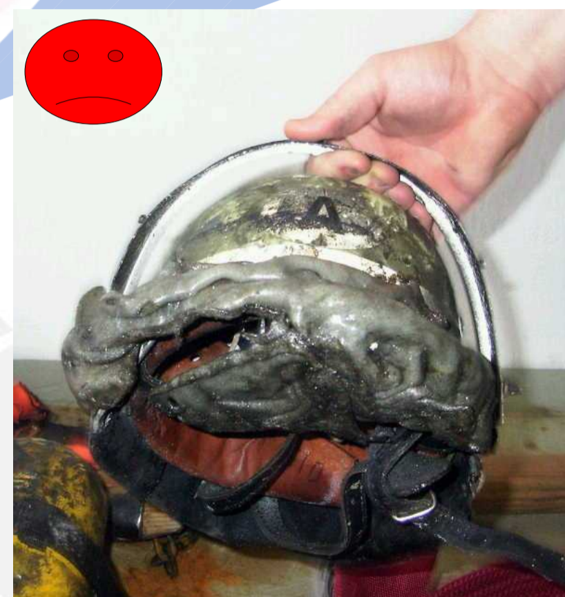
Visiere können schmelzen!