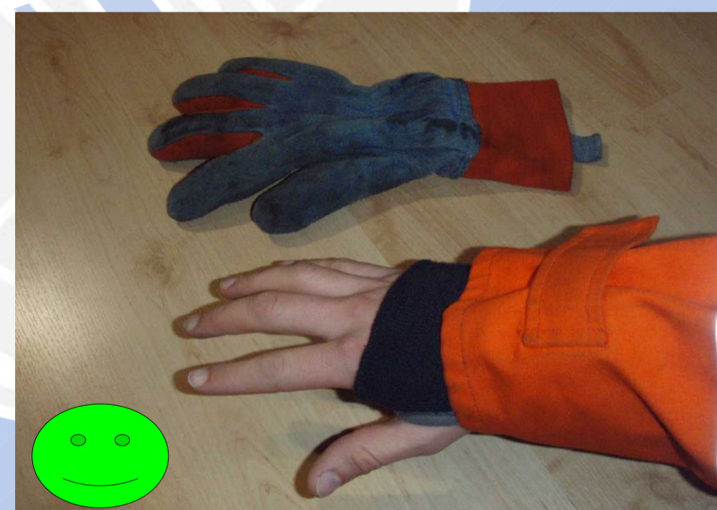
Jackenabschluss und Handschuh müssen kompatibel sein!

Schwelbrand in Scheune ⇒ Durchzündung (60 % KOF 2. u. 3°)