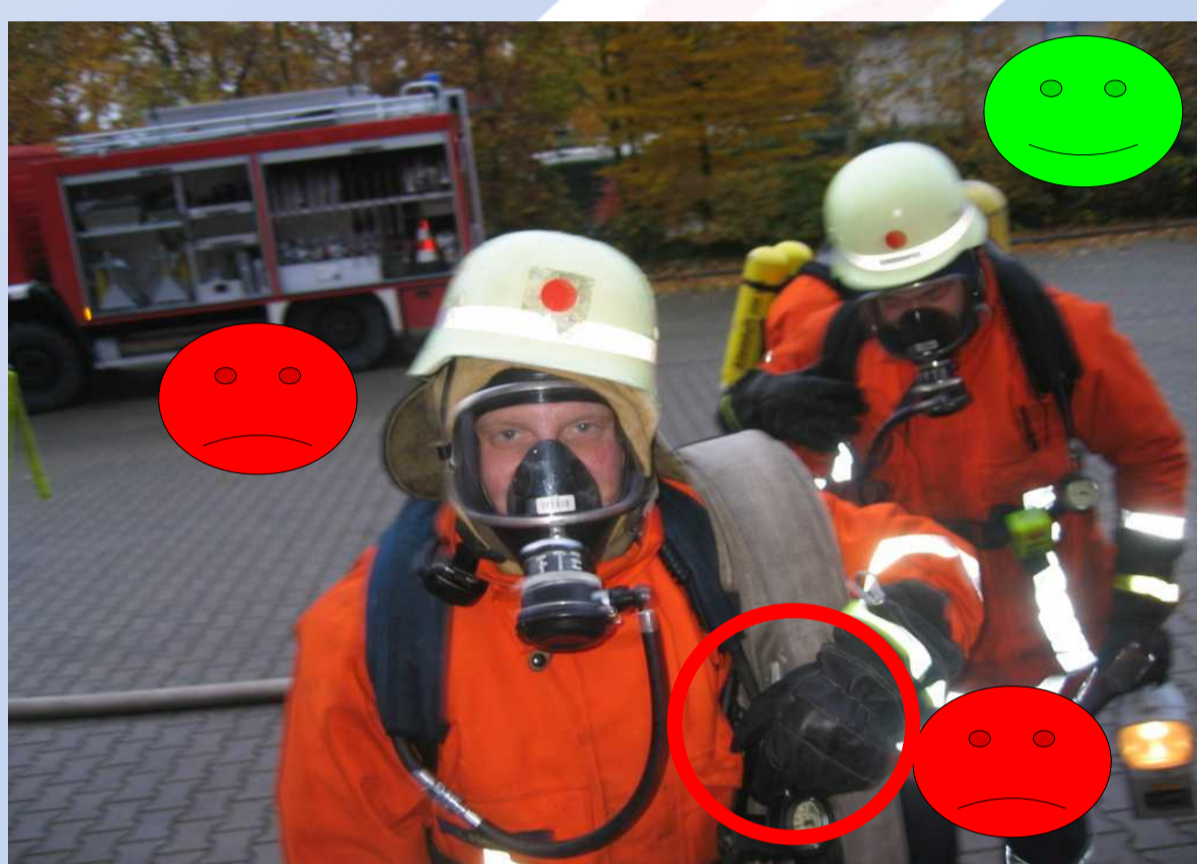
Das Innenleben muss dem Einsatzzweck (mit/ohne Maske) angepasst werden können!