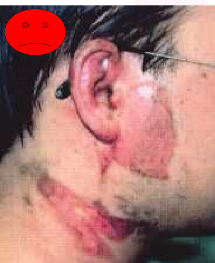
Keine Haube getragen!