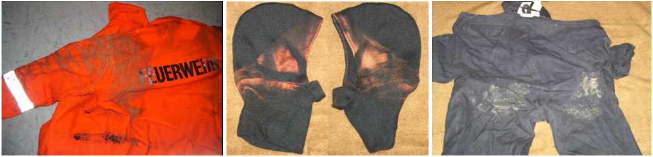
Abb. 16, 17, 18: beschädigte Einsatzkleidung nach F/O in Untergrombach Abb. 16 (l.): Überjacke mit Flammeneinwirkung (braune Stellen) Abb. 17 (m.): Flammenschutzhaube mit Flammeneinwirkung (braune Stellen) Abb. 18 (r.): einlagige Hose (HuPF Teil 2) mit angebrannten Hautresten (weiße Flecken)