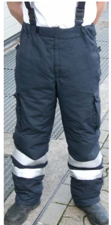
Abb. 1: Überhose HuPF 4B, Design Niedersachsen

Feuerwehr-Überhosen sind Hosen, die zum Schutz des Trägers bei der Bekämpfung von Schadensfeuern (z.B.: Wohnungsbrand) konzipiert wurden. Sie sind mehrlagig aufgebaut und bestehen aus mindestens 3 Stofflagen. Der Oberstoff besteht aus Meta-Aramid (z.B. unter den Marken Nomex® und Kermel® bekannt). Aramide sind sehr strapazier- und leistungsfähige Gewebe, die nicht brennen, nicht abtropfen und nicht schmelzen. Sie besitzen einen hohen thermischen Schutz und verkohlen bei einer Temperatur von ca. 400°C. Nomex® wird seit ca. 25 Jahren im Bergbau und im militärischen Bereich zum Schutz vor Flammeneinwirkung eingesetzt. Unter dem Oberstoff kann eine Funktionsmembrane (z.B.: Sympatex®, Goretex®) folgen. Darunter wiederum befindet sich eine als Vlies ausgeführte Aramidschicht, die mit einer weiteren Gewebeschicht aus Aramid verstept wird. Diese Zusammensetzung verleiht Überhosen eine Dicke von 1-2 cm und somit hohes Isolationsvermögen vor Wärmestrahlung. Ihre Funktion als Wärmeschutz führen sie zum Beispiel bei plötzlichen Ereignissen innerhalb einer Brandwohnung aus, wenn es zu einer starken Hitzestrahlung durch einen Flashover, eine Rauchgasdurchzündung oder einen Backdraft kommt (weitere Infos hierzu siehe: „3 Gefahren während des Einsatzes“). So bewahrt sie den Träger für eine gewisse Zeit vor Verbrennungen der Beine.