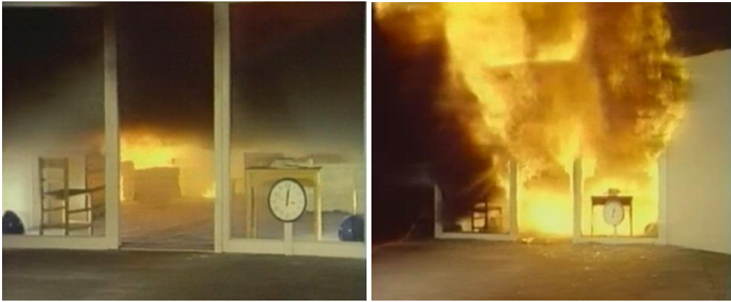
Abb. 4, links: die vorn stehenden Einrichtungsgegenstände sind noch nicht entzündet, die Rauchsicht ist stark erwärmt, steht kurz vor der Durchzündung (20 Sekunden später Durchzündung)