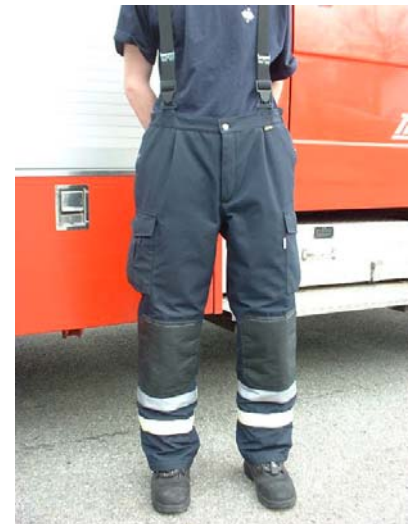
Abb. 2: Sonderanfertigung einer Überhose im Design „Bayern 2000“

Der Landesfeuerwehrverband Bayern selbst hat als Empfehlung den Schutzanzug Bayern 2000 entwickelt. Dieser besteht aus einlagiger Schutzhose und einlagiger Jacke (EN 531). Für den Innenangriff wurde ergänzend die Atemschutzüberjacke nach EN 469 entwickelt. Bei diesem Konzept wird allerdings die Hose von der EN 469 explizit ausgenommen, da durch die niedrigere Schutzeigenschaft ein „Hitze Fenster“ geschaffen werden soll. Dies wurde auch so im Printmedium des LFV Bayern „Florian kommen“ in Zusammenarbeit mit dem GUV Bayern Anfang 2005 publiziert 12 . Selbst ein großer bayerischer Hersteller von Feuerwehrsicherheitskleidung spricht bei mehrlagigen Hosen mit Hitzeisolierung von „Überprotektion“. 13