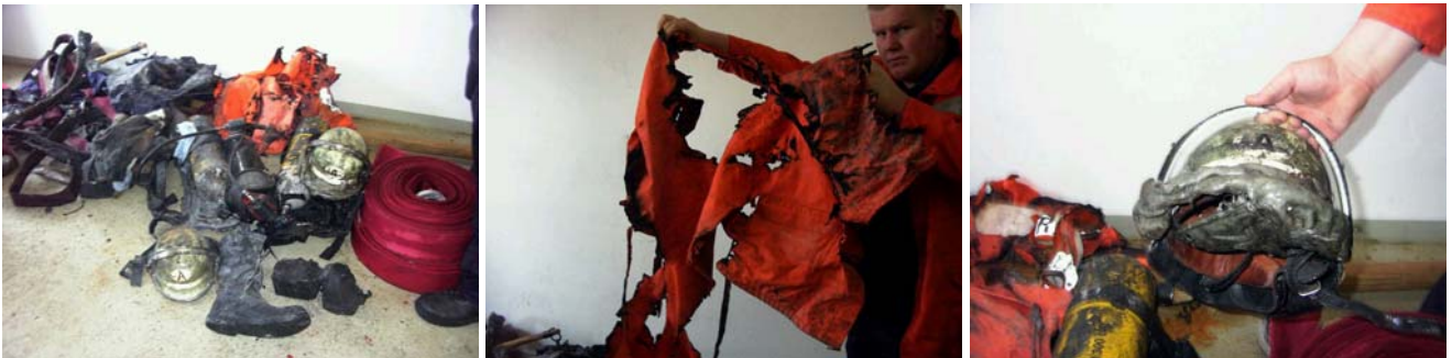
Abb. 19,20, 21: zerstörte Einsatzkleidung nach einem Flashover in Winterfeld (Sachsen-Anhalt).

Zwei Atemschutzgeräteträger gerieten während des Innenangriffs in einer Scheune in Winterfeld (Sachsen-Anhalt) in einen Flashover. Sie trugen nur einlagige, unzureichende „Schutz“kleidung aus Baumwolle (Hose und Jacke). Mit Brandverletzungen zweiten und dritten Grades wurden anschließend beide Feuerwehrmänner (40 und 37 Jahre) in eine Hamburger Spezialklinik gebracht. Hände, Arme und das Gesicht wurden schwer brandverletzt, bis zu 60% der Körperoberfläche waren betroffen. 30 31