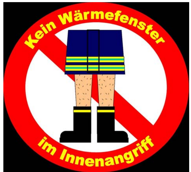
Abb. 22: NEIN zum Wärmefenster!

Die Argumentation einiger Personen, im Innenangriff sei eine einlagige Hose ein nützlicher Indikator für die Nähe des Trupps zum Brandherd (allgemein hin „Wärmefenster“ genannt, wobei der Begriff Hitzeschutzlücke treffender wäre), entbehrt wegen der Schwere der möglichen Verletzungen beim plötzlichen Hitzeanstieg durch Flashover etc. jeder Grundlage und kann nicht nachvollzogen werden. Der Einsatz einer einlagigen Hose im Innenangriff ist praxisfern, sinnlos und gefährlich.