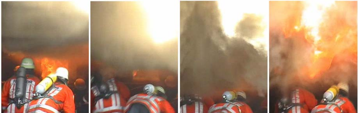
Abb. 6, 7 und 8: Kurz vor der Durchzündung stehende Rauchsicht Abb. 9, rechts: komplett durchgezündete Rauchsicht (ca. 5 Sekunden nach 1. Aufnahme aufgenommen) Ähnliches Video unter: http://www.atemschutzunfaelle.de/videos/foc-os-03-02-2.avi

Sollte sich dann noch ein Angriffstrupp im Raum befinden, bleiben ihm nur wenige Sekunden, diesen Raum zu verlassen oder einen Löschangriff durchzuführen.