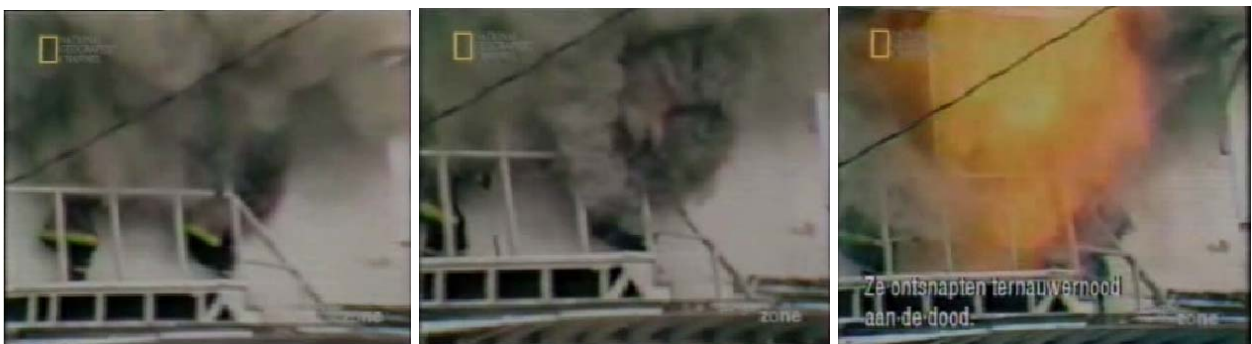
Abb. 10, 11, 12: Backdraft nach dem öffnen eines Fensters durch 2 FM. Zeitlicher Ablauf der Bilder: 2 Sekunden

Das Feuer im Brandraum erlischt durch Sauerstoffmangel, die Konzentration der brennbaren Gase steigt weit oberhalb der oberen Explosionsgrenze. Der Rauch kühlt sich ab und verliert dadurch an Volumen, es entsteht ein Unterdruck im Brandraum. Sobald eine Öffnung zum Raum geschaffen wird, wird Sauerstoff hinein gesogen. Bei genügender Vermischung mit dem Luftsauerstoff kommt die Konzentration der brennbaren Rauchgase wieder innerhalb der Explosionsgrenzen. 26 Als Zündquelle kann zum Beispiel nicht verloschene Glut dienen. 27 Es kommt zur Durchzündung mit der entsprechenden Druckausbreitung und zum Vollbrand des Raumes.