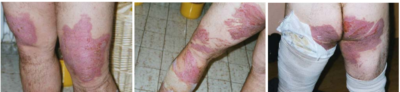
Abb. 13, 14, 15: schwere Brandverletzungen der Beine und des Gesäßes nach F/O in Untergrombach

Ein Feuerwehrangehöriger zog sich während eines Innenangriffs bei einem durch einen Saunabrand entstandenen Flashover 19%-ige Verbrennungen der Beine zu, weil er keine Überhose zur Verfügung hatte. Inzwischen (Stand: Oktober 2003) ist der Feuerwehrangehörige wieder völlig genesen und kehrt langsam ins Berufsleben zurück. 29